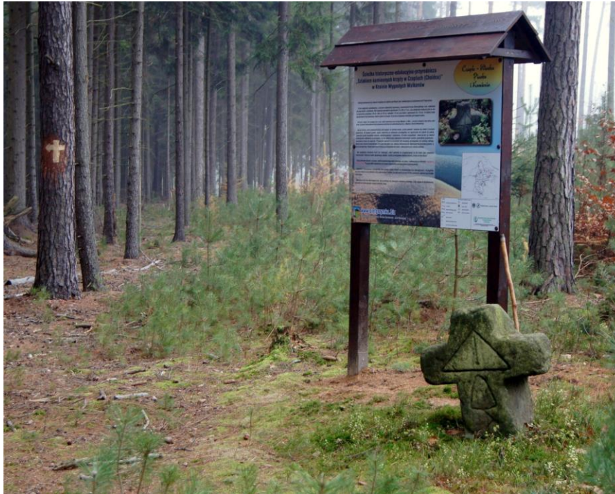
„Krzyż murarza”. Na drzewie widoczny jest znak ścieżki dydaktycznej.