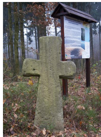
Krzyże Skorzynice I (Czaple) i Skorzynice II