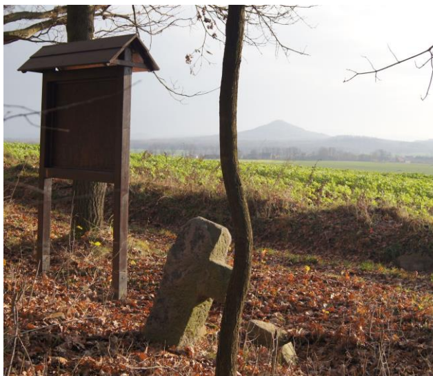
Widok na Ostrzycę spod krzyża w Rochowie

nie ma żadnej innej informacji. Okazuje się, że prawdziwie rewelacyjna niespodzianka, godna reklamy lub choćby wskazania drogi, znajduje się w dolnej części wsi, schowana na placu za wiejską świetlicą obok skromnej remizy OSP. Ustawiono tam zminiaturyzowane kopie wszystkich siedmiu krzyży (oraz kamienia pamiątkowego) tworząc mini-ścieżkę dydaktyczną. Kopie są wykute z piaskowca(!) i oddają charakterystyczne cechy oryginałów, a przy każdym obiekcie znajduje się mała tabliczka z opisem.