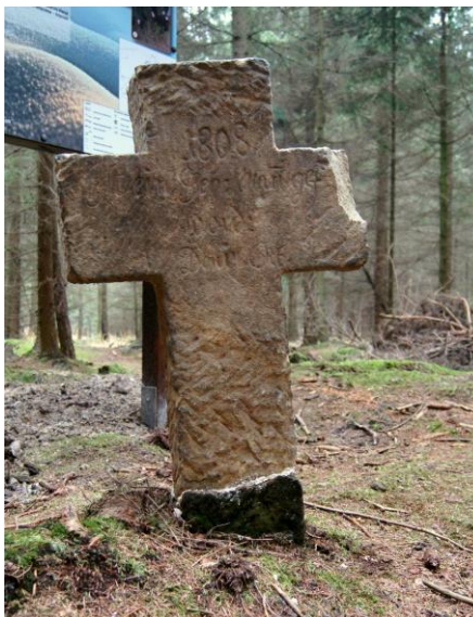
Nowoodkryty krzyż kamienny z 1808 r. w Nowych Łąkach

Trasa szlaku tworzy pętlę liczącą ok. 14 km i przebiega duktami, ścieżkami, a czasem na przełaj przez tzw. Złotoryjski Las, leżący na granicy powiatów złotoryjskiego i lwóweckiego, po