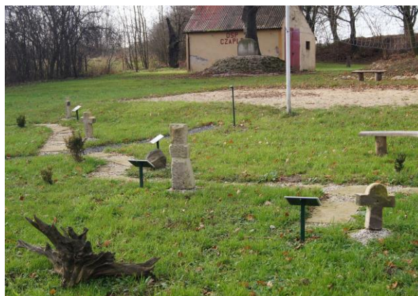
Mini-ścieżka „krzyżowa” we wsi Czapple

https://www.youtube.com/watch?v=LCUx02JhlxM&feature=youtu.be