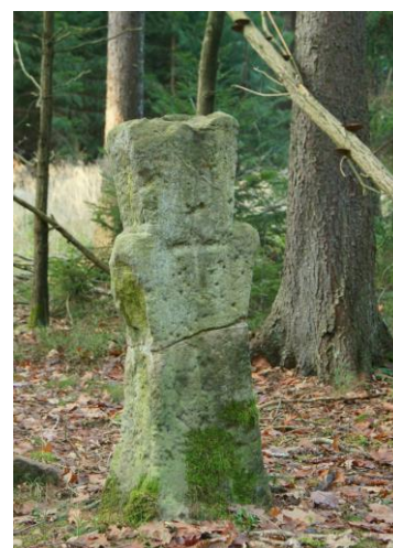
Uszkodzony krzyż Choiniec II

W terenie szlak jest znakowany krzyżo-strzałkami malowanymi złotą farbą na korze drzew – znakowanie bardzo oryginalne, ale niepraktyczne (już kilkanaście dni po otwarciu niektóre znaki były zatarte). W dodatku tak znaki, jak i opisy umieszczone na tablicach zakładają jeden kierunek marszu – w kolejności rosnących numerów od K1 do K7 (np. „idąc dalej dochodzimy do...”). Co gorsza, na wielu odcinkach w ogóle nie ma znaków, a przy rozwidleniach dróg brak znaków potwierdzających. Jest to przyczynek do narastającego od lat chaosu w znakowaniu szlaków turystycznych: oprócz tradycyjnego, sprawdzonego systemu, pojawiły się znaki narciarskie, rowerowe a nawet końskie plus rozmaite warianty dojściowe. Przez Złotoryjski Las przebiegają już trzy stare szlaki – niebieski, zielony i żółty, więc aby uniknąć kolizji można by szlak krzyżowy wyznakować jako czarny, zachowując standardowy kształt i wielkość malowanych znaków, a przede wszystkim reguły ich umieszczania. Przy