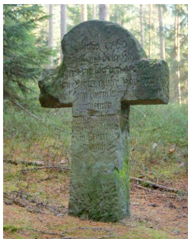
Smutna historia wykuta na krzyżu Choiniec I

Nowy szlak ułatwia odwiedzenie wszystkich siedmiu krzyży, gdyż dotychczas było dość trudno do nich trafić. Planując wycieczkę, czy spacer, można wybrać tylko fragment trasy startując np. z któregoś z 3 miejsc wypoczynkowych usytuowanych w pobliżu szosy Lwówek – Złotoryja lub z uroczego miejsca pod górą Świątek k. Rochowa. Wszędzie tam są solidne wiaty i tablice informacyjne. Podobne tablice ustawiono przy każdym krzyżu, jak również przy kamieniu pamiątkowym z początku XX w. leżącym na skrzyżowaniu ze szlakiem zielonym, ok. 1 km na południe od Choinca. Każda tablica ma zindywidualizowaną treść (autorzy: Roman Gorzkowski i Józef Banaszek) – zawiera opis